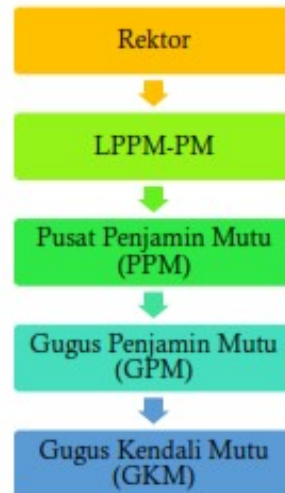
Gambar 2.4 Struktur Organisasi Universitas Samudra

Dengan dibentuknya Pusat Penjaminan Mutu Universitas Samudra, maka struktur organisasi Universitas Samudra dapat disajikan pada gambar berikut: