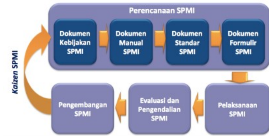
Gambar 2.2 Mekanisme Implementasi SPMI