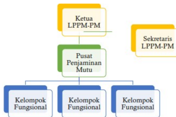
Gambar 2.3 Struktur Pusat Penjaminan Mutu Universitas Samudra

Universitas Samudra memiliki 5 (lima) Fakultas, 25 (dua puluh lima) Program Studi, 2 (dua) Biro, 1 (satu) Lembaga, 1 (satu) satuan dan 4 (empat) UPT. Universitas Samudra menetapkan bahwa mulai tahun 2022 seluruh unit kerja akademik maupun non-akademik secara bertahap pada setiap aras harus melaksanakan SPMI dalam setiap aktivitasnya. Agar pelaksanaan SPMI Universitas Samudra pada semua unit dan aras dapat berjalan lancar dan terkoordinasi secara efektif, maka siklus pertama SPMI Universitas Samudra dilakukan mulai tahun 2018 dengan membentuk Pusat Penjaminan Mutu yang secara khusus bertugas merencanakan, merancang, menetapkan, melaksanakan, mengevaluasi, mengendalikan, dan mengembangkan SPMI Universitas Samudra. Berikut struktur Pusat Penjaminan Mutu Universitas Samudra: